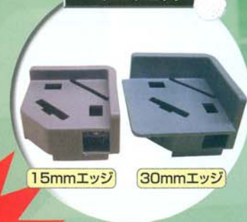
コーナーブロック