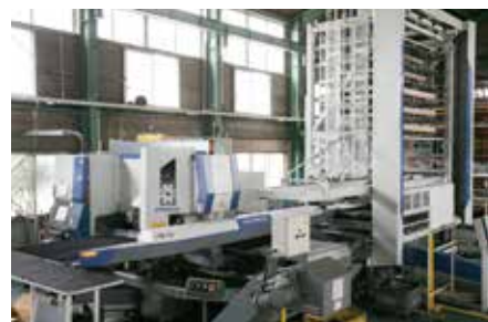
ムラテック製 レーザーパンチプレス/自動搬送システム