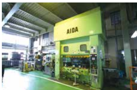
アイダ製 300t~500t 順送プレス