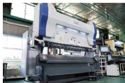
ムラテック製 185t プレスブレーキ