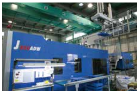
日本製鋼所製 450t~850t 射出成型機