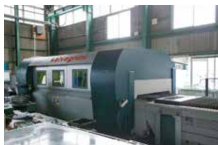
サルバニーニ製 L3 ファイバーレーザー