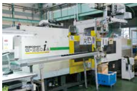
ファナック製 100t~350t 射出成型機